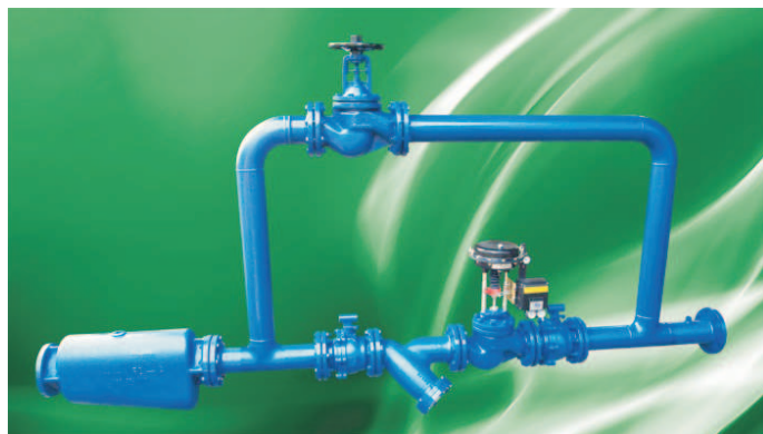
Estação de Controle de Pressão Montada

As vantagens para os clientes são significativas. Por exemplo, na última estação de aquecimento que fornecemos, a lista de materiais que compunha a estação continha aproximadamente 46 itens, que tiveram que ser individualmente dimensionados, orçados e comprados de mais de 10 fornecedores diferentes.